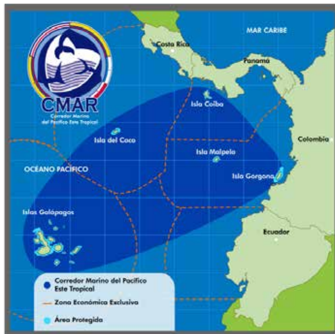
Figura 2. Corredor Marino del Pacífico Este Tropical.

En abril del 2004 los representantes de los Gobiernos de Costa Rica, Panamá, Colombia y Ecuador, firmaron la Declaración de San José, que busca la adecuada gestión de la biodiversidad y los recursos marinos y costeros del Corredor Marino del Pacífico Este Tropical de 4 países: Costa Rica, Panamá, Colombia y Ecuador, ver figura 2, mediante un manejo ecosistémico, y a través del establecimiento de estrategias regionales gubernamentales conjuntas apoyadas por la sociedad civil, organismos de cooperación internacional y no gubernamentales. El CMAR enmarcado en sus Áreas Núcleo que corresponden a las áreas marinas protegidas de la Isla del Coco (Costa Rica), Isla Coiba (Panamá), Islas Malpelo y Gorgona (Colombia) y Archipiélago de Galápagos (Ecuador). De estas cinco áreas protegidas, cuatro son actualmente Patrimonio Mundial de la Humanidad de la UNESCO, es decir son lugares únicos en el Planeta con Valor Universal Excepcional por sus fenómenos naturales, procesos geológicos, desarrollo ecológico y extraordinaria biodiversidad (Bilder, 2009).