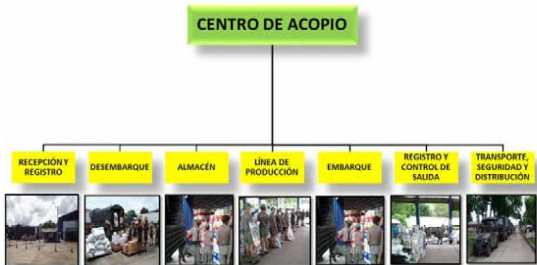
“Organización y Procesos de los Centros de Acopio implementados por el Sistema Logístico del Ejército”