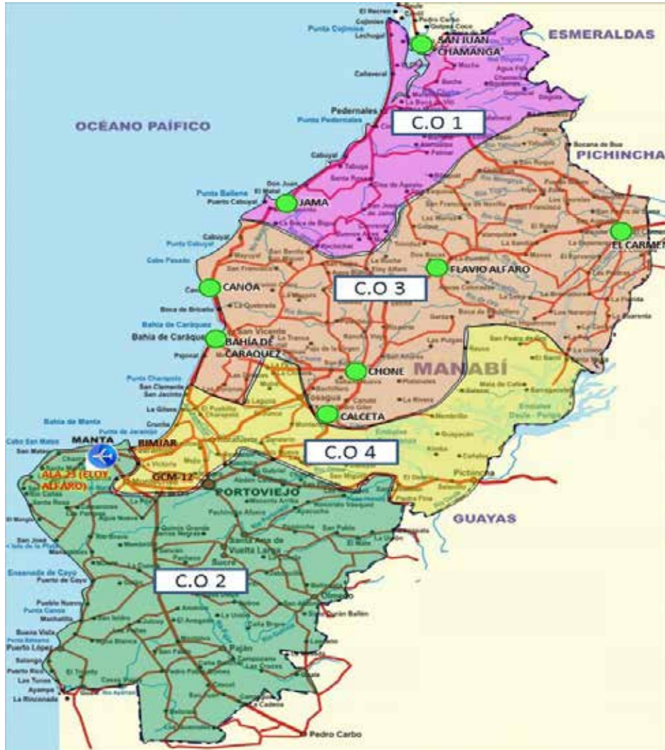
Figura N° 1: Zona especial de defensa “Eloy Alfaro”.

El área de estudio de esta investigación incluye las provincias de Esmeraldas y Manabí, que estratégicamente conformaron la Zona Especial de Defensa “Eloy Alfaro” (ZED), que se organizó en sub-zonas especiales de defensa (SZED), materializadas por los Comandos Operacionales de las FF.AA.