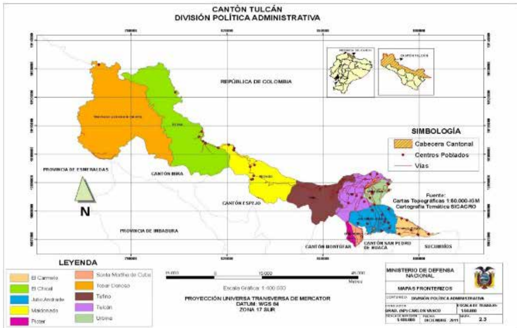
Mapa N° 3. división política administrativa del Cantón Tulcán

El Cantón Tulcán tiene una estructura territorial rectangular, en forma de faja. Esto significa que su longitud es desproporcionada con relación al ancho; en consecuencia esta organización política, por su conformación, presenta una serie de problemas de carácter político, social, administrativo, económico y de defensa. Cada uno de estos componentes tiene su especial particularidad en el área que se analiza, donde es importante considerar la distribución geográfica política de las parroquias rurales que configuran el Cantón Tulcán.