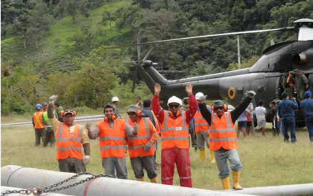
Foto N° 4. Transporte de material para proyecto de electrificación

respiratorio. Como infraestructura de salud disponen de un policlínico, en el que atienden dos médicos generales, un odontólogo, dos enfermeras, un tecnólogo y un chofer para la ambulancia, disponiendo de una botica con insuficiencia de medicinas.