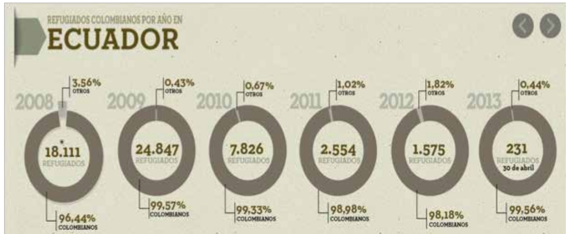
Gráfico 2, Refugiados colombianos por Año 2008-2013. Fuente: Dirección de Refugio, Ministerio de Relaciones Exteriores y Movilidad Humana del Ecuador, diario El Universo.

El siguiente gráfico muestra la cantidad de refugiados en los últimos seis años.