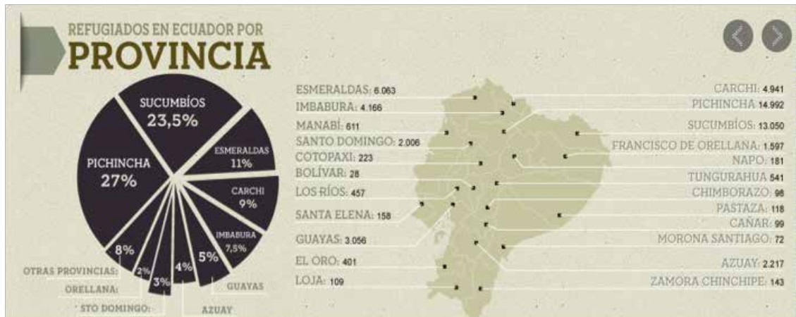
Gráfico 3, Fuente: Dirección de Refugio, Ministerio de Relaciones Exteriores y Movilidad Humana del Ecuador, diario El Universo.

Tal como se evidencia en la imagen anterior, la provincia céntrica de Pichincha concentra la más alta cantidad de número de refugiados colombianos en el Ecuador (14.992), luego le sigue la provincia amazónica fronteriza de Sucumbíos (13.050), que limita con el departamento fronterizo de Putumayo, y en cuyas selvas operarían los frentes 38 y 42 de las FARC. En tercer lugar le sigue la también provincia fronteriza costera de Esmeraldas (6.063) la cual colinda con el departamento colombiano de Nariño, donde operaría el frente 49 de las FARC y se concentraría el mayor número de hectáreas de hoja de coca de toda Colombia. Luego le siguen otras provincias céntricas, cuyos puntos de concentración serían los centros comerciales en ciudades principales, tal es el caso de Imbabura (3.166), Guayas (3.056), Azuay (2.217), Santo Domingo de los Tsachilas (2.006), entre otras.